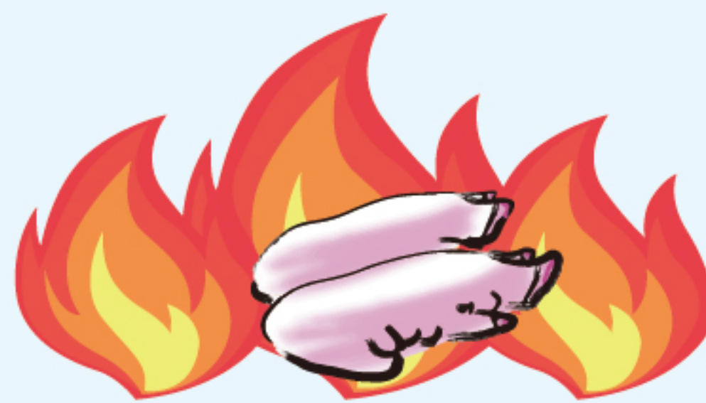
“焚烧炉” 无害化处理